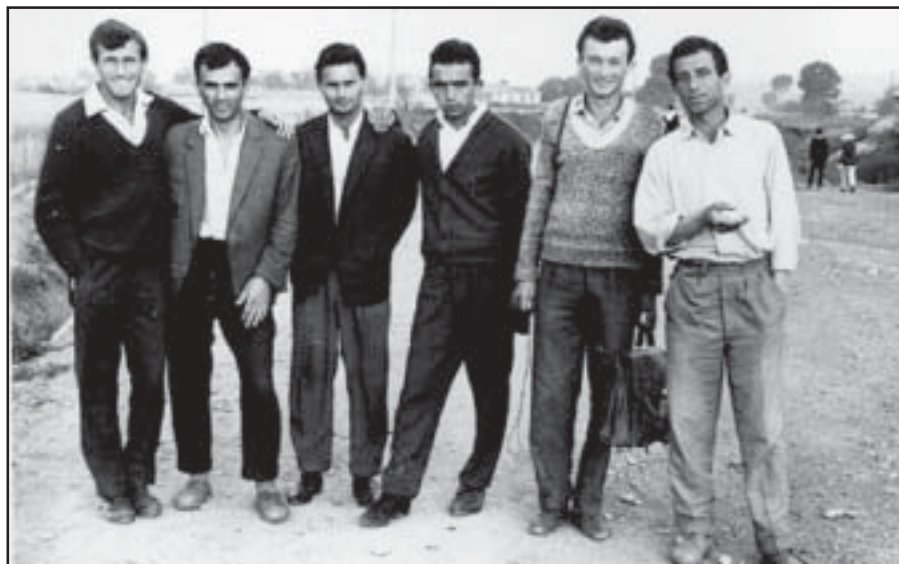
Redaksia e gazetës "Studenti" në hekurudhë, Gradishtë, qershor 1967

reflektonin emrione talentesh. Me pranire e tyre ata te jepnin force e besim, ta lehtesonin punen dhe lodhjen. Edhe pse do te diplomoheshin per drejtessi, me tehiqte fort gazetaria, sepse megjithese ato jane dy profesione e degje te ndryshme, kane dicka thelbesore te perbashket: zbulimin e pasqyrimin e se vertetes dhe ndertimin e drejtesses nbi kete te vertete."